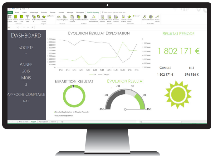
Dashboard du Résultat d'exploitation